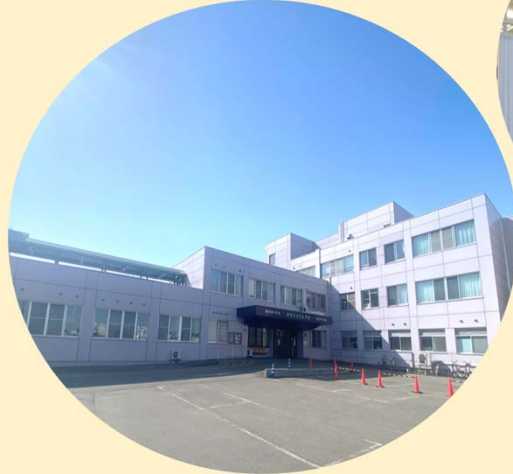
岩見沢北翔会病院 外観

脳卒中、脊髄損傷、整形外科手術後、神経筋疾患、廃用症候群などの患者さんを対象に、早期の家庭・社会復帰を目的として集中的なリハビリを行う病棟です。